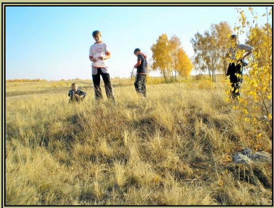
Курган с каменным панцирем

В разные периоды своей истории Анненское последовательно носило статус станицы, отряда, поселка. Первоначально основано на берегу р. Берсуат в 1837 г. как казачья станица на Новой пограничной линии. Для отражения набегов кочевников в станице установили 2 чугунные пушки на полевых лафетах. Со временем оборонное значение поселения ослабло и ввиду неудовлетворительных условий (недоброкачественной воды, отсутствия леса, недостатка сенокосных угодий) населенный пункт в 1864 г. был перемещен на новое место. По данным статистики, в 1866 г. в Анненском отряде насчитывалось 378 жителей (60 дворов), в 1897 — 873 жителей (147 дворов), имелись церковь, начальные школы для мальчиков и девочек, 3 водяные и 6 ветряных мельниц. Анненские казаки участвовали во всех войнах 2-й половины 19 — начало 20 вв.